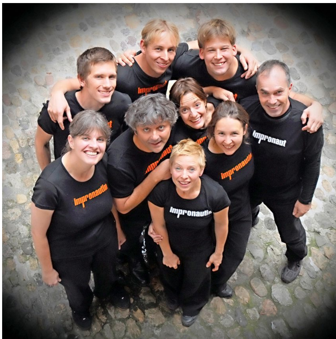
Die Impronauten stehen mit ihrem Stück «Wir gegen uns!» im Theater Fauteuil auf der Bühne.

Veranstaltungshinweise für die Basler Zeitung können über die Website www.eventbooster.ch erfasst werden.